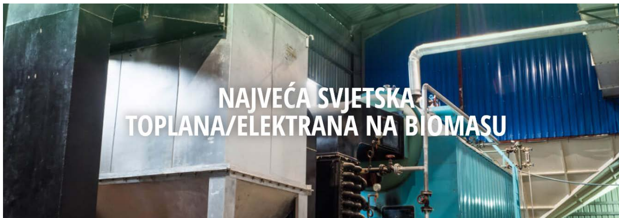
Avedøre, Kopenhagen - Danska